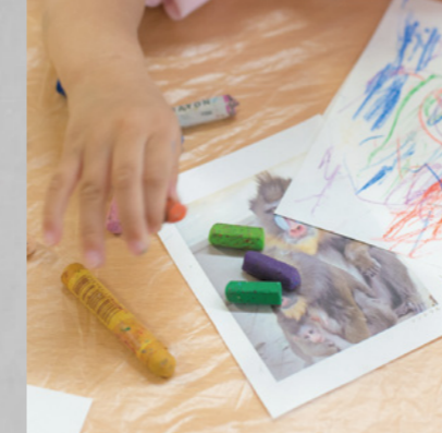
Kids Drawing